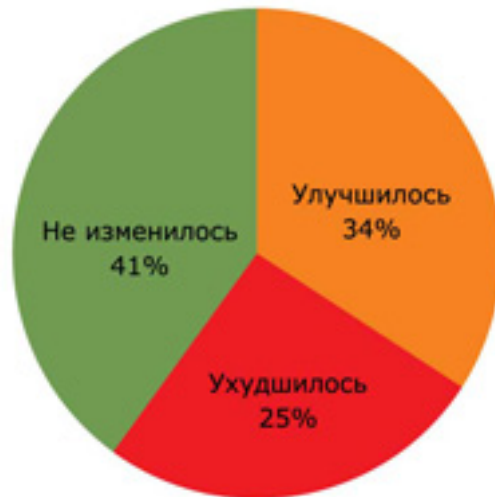
Рис. 3 Распределение испытуемых по динамике состояния кожи (показатель «шелушение») после завершения исследования.