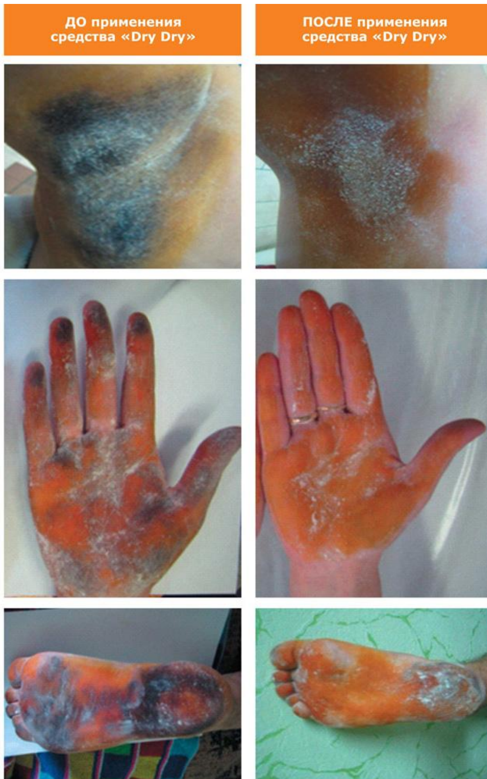
Рис. 1 Макрофотографии проблемной зоны при выполнении пробы Минора. В ходе пробы нанесений йода и крахмала участки с потовыделением окрашиваются в синий цвет, участки без потовыделения остаются желтыми.